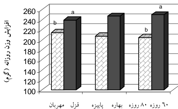
شکل ۲- میانگین حداقل مربعات افزایش وزن روزانه بر اساس نژاد، طول دوره و فصل پروار

رشد بره‌های جوان‌تر در پرواربندی بهاره، ضریب تبدیل غذایی کمتر بود. مقایسه میانگین حداقل مربعات صفات مورد بررسی بر اساس نژاد و زمان پروار در جدول ۲ نشان داده شده است. طول مدت پروار اثر معنی‌داری بر مصرف خوراک،